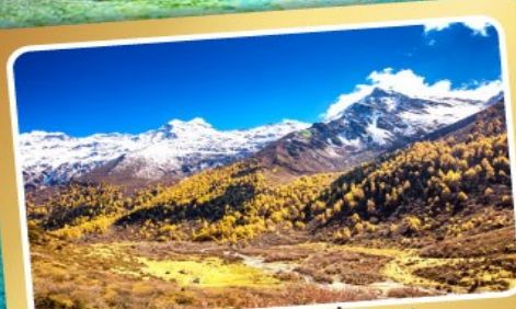
อุทยานภูเขาสิ่ดรุณี