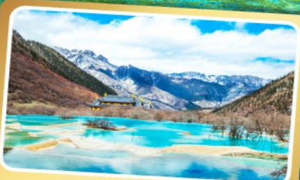
อุทยานหองหลง