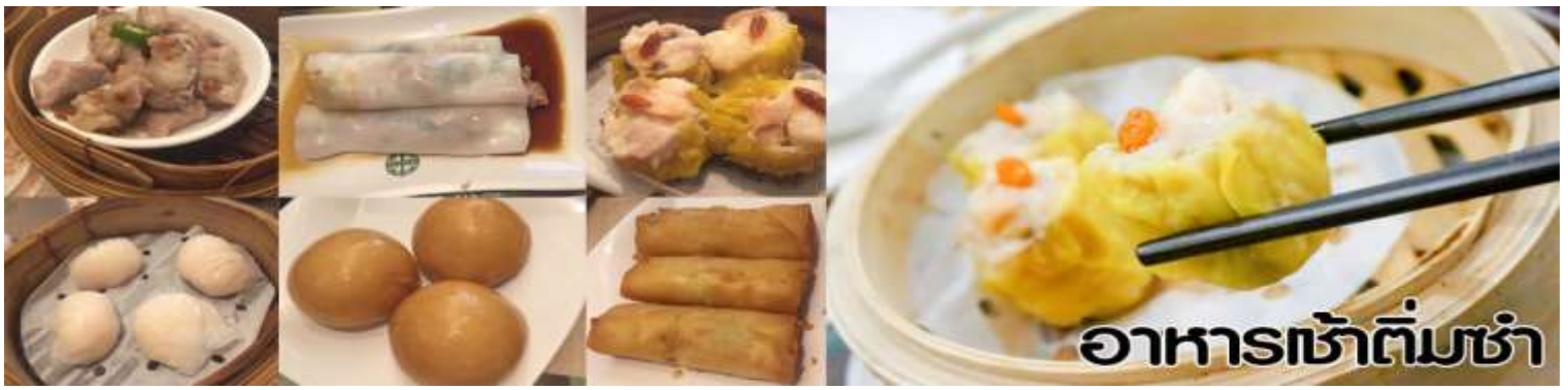
อาหารเช้าทีมซ่า

นำทุกท่าน ไหว้ศาลเจ้าแม่ทับทิม ทินหัว (Tin Hau Temple) เป็นวัดเก่าแก่และสำคัญอีกวัดหนึ่งของฮ่องกง เพราะในสมัยก่อนฮ่องกงเป็นเพียงหมู่บ้านชาวประมง ซึ่งเคารพนับถือเจ้าแม่ทับทิมว่าเป็นเทพีแห่งทะเล เพื่อให้เดินทางปลอดภัย เวลาออกไปทำงานไกล ๆ หรือออกหาปลา นอกจากการมาสักการะบูชาเจ้าแม่ทับทิมในเรื่องของการเดินทางให้ปลอดภัยแล้ว ไฮไลท์สำคัญอีกอย่างหนึ่งของ วัดเจ้าแม่ทับทิม ทินหัว (Tin Hau Temple) จะเป็นขดรูปสีแดงขนาดใหญ่ ที่แขวนอยู่ตามเพดานด้านในวิหารของวัดเต็มไปหมด จะยิ่งสวยงามในยามที่มีแสงแดงส่องลงมาเหมือนเป็นลำแสงส่องทะเลดูวันรูปแปลกตายิ่งนัก ส่วนอาคารของวัดก็จะเป็นสถาปัตยกรรมแบบวัดจีน สร้างขึ้นตั้งแต่ปีค.ศ. 1876 โดยทางเข้าของวัดจะอยู่ติดกับสวนสาธารณะเล็ก ๆ ที่มีต้นไม้ใหญ่หลายต้น ให้บรรยากาศร่มรื่น