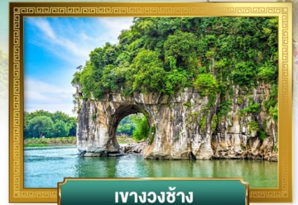
เขาวงวงช้าง