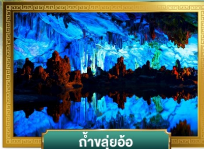
ถ้ำสุ่ยอ้อ