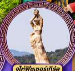
จูโห้ฟิชเชอร์เทิร์ล