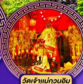
วัดเจ้าแม่กวนอิม ช่องฮ่า