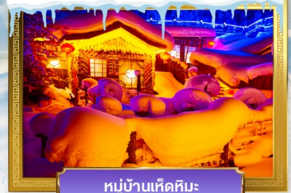
หมู่บ้านเห็ดหิมะ

เดินทางโดย : สายการบินเซินเจิ้นแอร์ไลน์ (ZH)