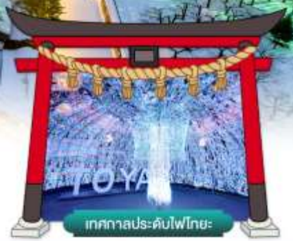
เทศกาลประดับไฟไทยะ