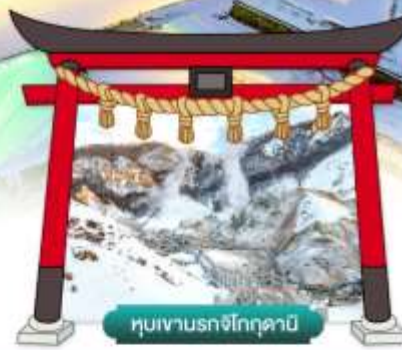
หุบเขานรกจโกกูดานิ