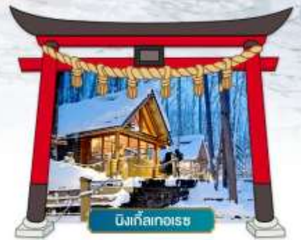
นิงเกิลเกอเรซ