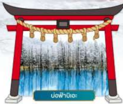
บ่อน้ำปิเอะ

☑ ชมความสวยงามท่ามกลางหิมะ ณ หมู่บ้านเทพนิยาย นิงเกิลเกอเรซ