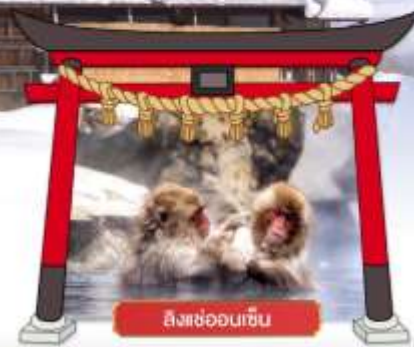
ลิงแสมออนเซ็น

เดินทางโดยสายการบิน : ไทยแอร์เอเชียเอ็กซ์