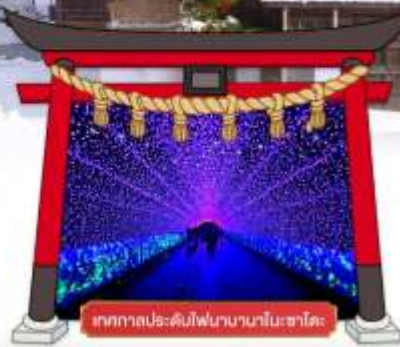
เทศกาลประดับไฟนากาโนะซาโตะ