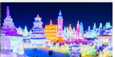
เทศกาลโคมไฟน้ำแข็ง

*ทางบริษัทฯ ขอสงวนสิทธิ์ในการสลับโปรแกรมทัวร์ตามความเหมาะสมขึ้นอยู่กับสถานการณ์หน้างาน โดยคำนึงถึงผลประโยชน์ของลูกค้าเป็นสำคัญ