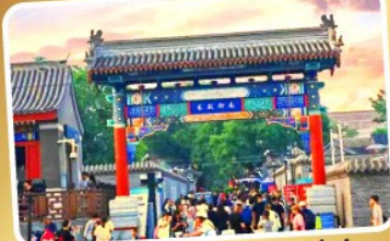
ถนนโบราณหนานหลวู่เกี๋ยง