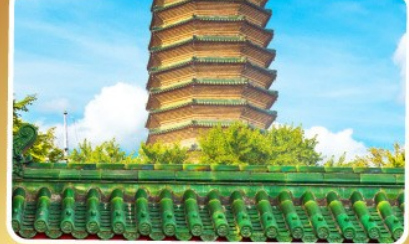
วัดพระเจี๋ยวแก๋ว