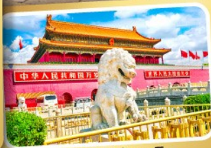
จุดริสเทียนอันเหมิน