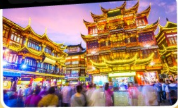
ตลาดร้อยปีเจิ้งหวังเมี่ยว