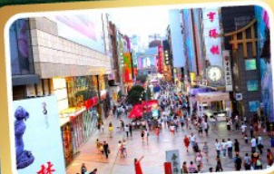
ช้อปปิ้งถนนชุนชิว