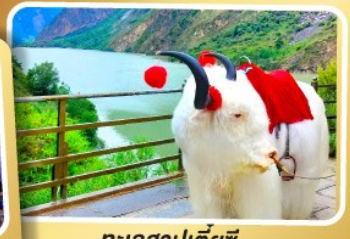
ทะเลสาปเต๋ยซี