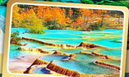
อุทยานหองหลง