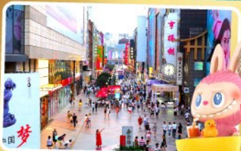
ถนนคนเดินซุนชิลู่