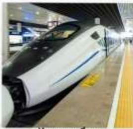
รถไฟความเร็วสูง สู่จิวจ้ายโกว