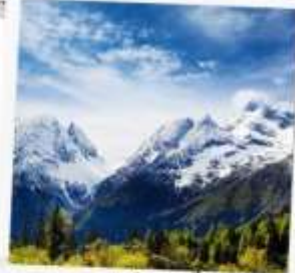
ภูเขาหิมะการ์เซีย ตำกู่ปิงชวณ