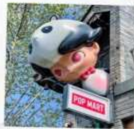
ชอยกวางแคบ