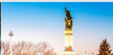
อนุสาวรีย์ฝิ่งหง