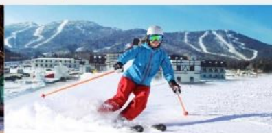
ลานสกียาปูลี