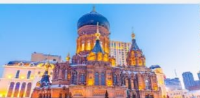
โบสถ์เซนต์ไอแซค