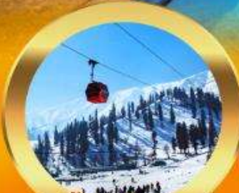
เคเบิลคาร์ กุลมาร์ค