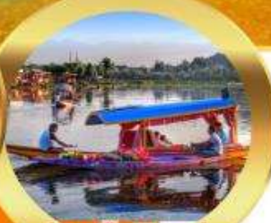
ล่องเรือชิคาร่า