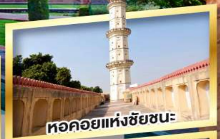
หอคอยแห่งชัยชนะ