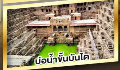
บ่อน้ำจันบินโด