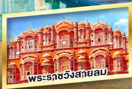
พระราชวังสกายม