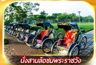
นั่งสามล้อชมพระราชวัง

สัมผัสความสวยงามหมู่บ้านสไตล์ฝรั่งเศสที่บานาฮิลล์ วัดเทียนมู่ พระราชวังเว้ สัมผัสเมืองโบราณฮอยอัน ล่องเรือกระดัง