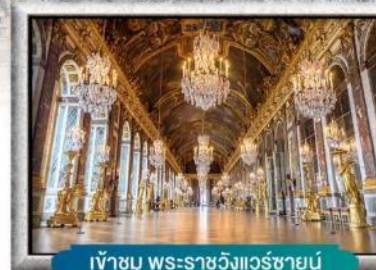
เข้าชม พระราชวังแวร์ซายน์