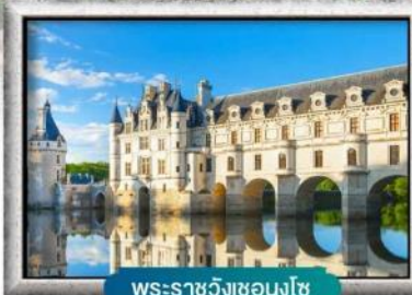
พระราชวังชองงโซ