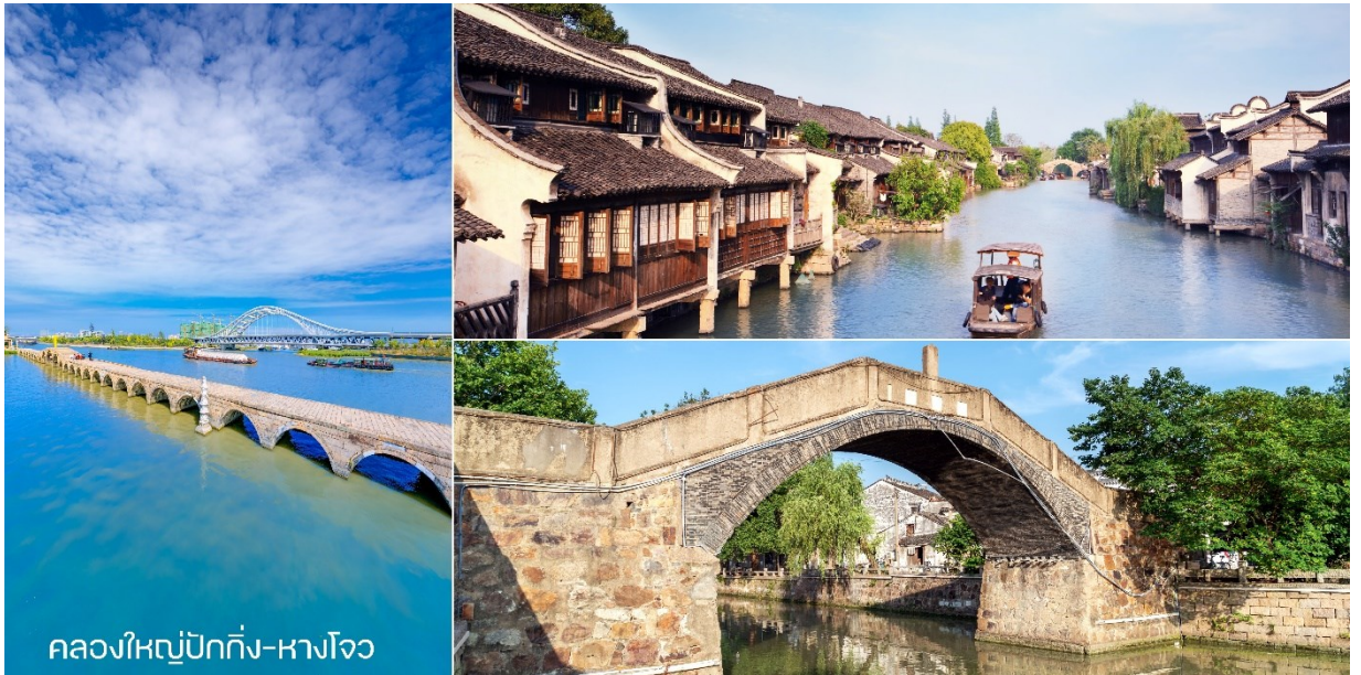
คลองใหญ่ปักกิ่ง-หางโจว

จากนั้นนำท่านล่องเรือ คลองใหญ่ปักกิ่ง-หางโจว ( Beijing-Hangzhou Grand Canal ) ซึ่งเป็นคลองขุดที่เก่าแก่และยาวที่สุดในโลก ได้เปิดพื้นที่คลองในส่วนเมืองซางโจวให้ท่องเที่ยวแล้วเมื่อวันที่ 1 กันยายนที่ผ่านมา เพื่อเปิดโอกาสให้ผู้มาเยือนได้ชื่นชมกับสุดยอดคลองขุดที่มีมาอย่างยาวนานของจีน คลองใหญ่ปักกิ่ง-หางโจว มีความยาวถึง 1,794 กิโลเมตร (1,115 ไมล์) ทั้งยังมีประวัติศาสตร์นานกว่า 2,500 ปี เริ่มตั้งแต่กรุงปักกิ่งทางตอนเหนือ ทอดยาวไปสุดที่เมืองหางโจวทางตอนใต้ของประเทศ และทำหน้าที่เป็นเส้นเลือดหลักในการเดินทางสมัยจีนโบราณ โดยหนึ่งในแปดของคลองนี้ทอดผ่านเมืองซางโจว ห่างจากกรุงปักกิ่งไปประมาณ 180 กิโลเมตร ยังถูกยกให้เป็นมรดกโลกเมื่อปี 2557 ด้วย จากนั้นให้ท่านได้เดินชมถนนหมู่บ้านวัฒนธรรม Xiaohu Street Historic หมู่บ้านคนเดินวัฒนธรรมที่มีชีวิตชีวาและน่ารัก ร้านกาแฟเล็กๆ ที่มีอาหารและชาและกาแฟ ร้านเสื้อผ้าสไตล์วินเทจ นอกจากนี้ยังมีร้านอาหารที่สามารถมองเห็นวิวแม่น้ำซึ่งสวยงามมากแนะนำมาก นำท่านชม สะพานกงเฉิน ( Gongchen Bridge )