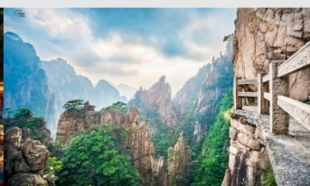
เขาหวงซาน