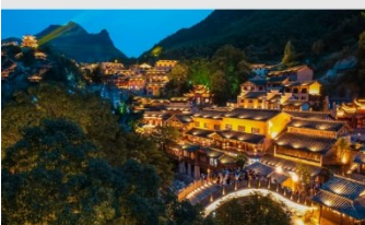
หุบเขาเทวดาวังเซียนกู่