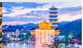
ล่องเรืออู๋หนี่โจว

*ทางบริษัทฯ ขอสงวนสิทธิ์ในการสลับโปรแกรมทัวร์ตามความเหมาะสมขึ้นอยู่กับสถานการณ์หน้างาน โดยคำนึงถึงผลประโยชน์ของลูกค้าเป็นสำคัญ