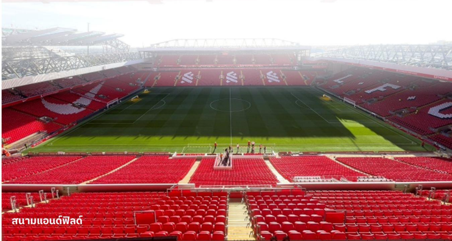
สนามแอนด์ฟิลด์

หนึ่งในสถานที่ท่องเที่ยวที่ใหญ่ที่สุดในเมืองลิเวอร์พูล โดยบริเวณท่าเรือนี้ประกอบไปด้วยอาคารท่าเรือและคลังสินค้านอกจากนี้แล้วท่าอัลเบิร์ตยังเป็นสถานที่ท่องเที่ยวที่มีคนเข้าชมมากที่สุดในสหราชอาณาจักรอีกด้วย