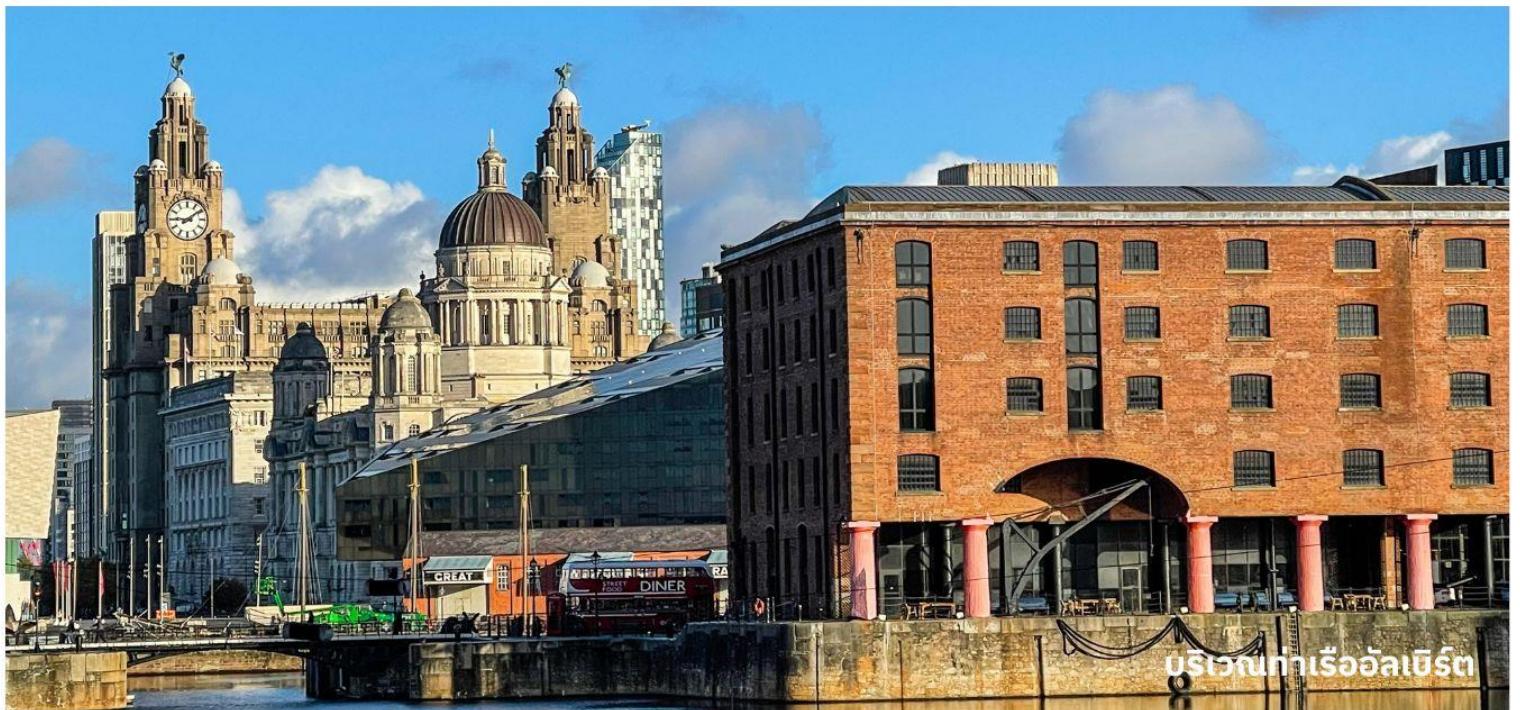
บริเวณท่าเรืออัลเบิร์ต

ออกเดินทางสู่ ดูไบ ประเทศสหรัฐอาหรับเอมิเรตส์ โดยสารการบินเอมิเรตส์ เที่ยวบินที่ EK020 (บริการอาหารและเครื่องดื่มบนเครื่องบิน)