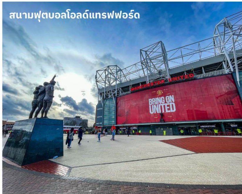
สนามฟุตบอลโอลด์แทรฟฟอร์ด

จากนั้นนำท่านเดินทางสู่ เมืองแมนเชสเตอร์ ใช้เวลาเดินทางประมาณ 1 ชั่วโมง เป็นอีกหนึ่งเมืองท่าที่สำคัญของประเทศอังกฤษและยังเป็นเมืองที่มีประชากรมากที่สุดเป็นอันดับสองของประเทศอังกฤษ รองจากมหานครลอนดอน จากนั้นนำท่านถ่ายรูปด้านหน้า สนามฟุตบอลโอลด์แทรฟฟอร์ด แห่งทีมแมนเชสเตอร์ยูไนเต็ด สโมสรฟุตบอลชื่อดังโลกที่มีสมาชิกแฟนคลับมากที่สุดในโลก เจ้าของสมญานาม “ปีศาจแดง” สนามเริ่มก่อสร้างในปี 1909 และเริ่มใช้ตั้งแต่ปี 1910 ปัจจุบันมีความจุ 76,212 คน