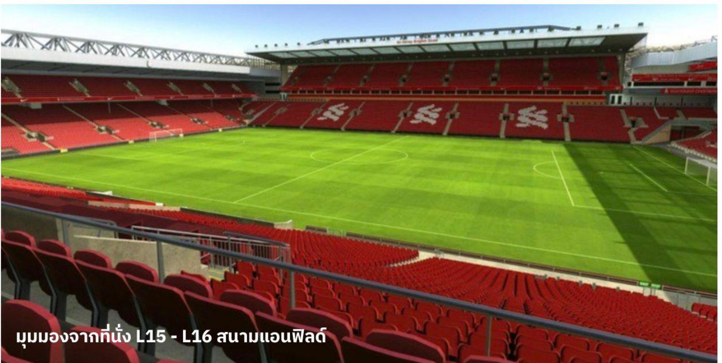
มุมมองจากที่นั่ง L15 - L16 สนามแอนฟิลด์

นำท่านเข้าสู่ที่พัก Mercure Liverpool Atlantic Tower Hotel หรือเทียบเท่า