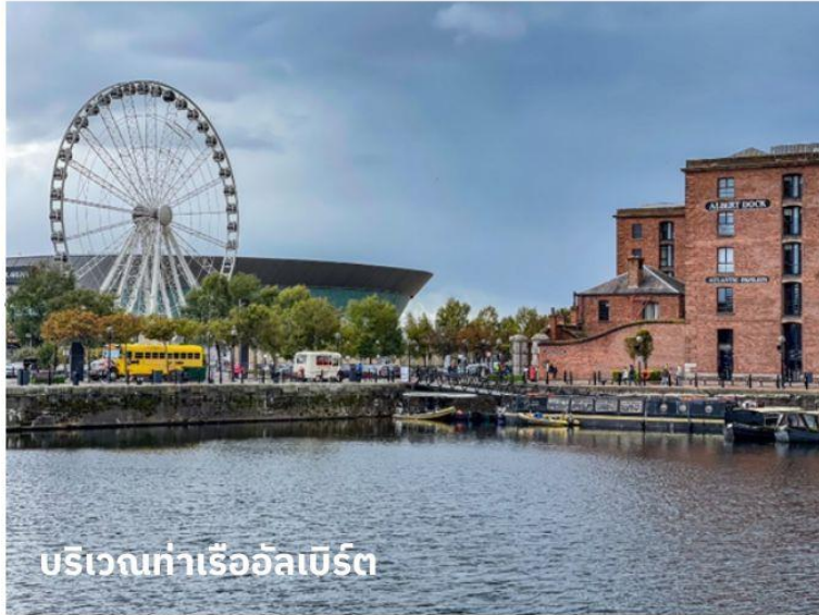
บริเวณท่าเรืออัลเบิร์ต

จากนั้นนำท่านเดินทางสู่ เมืองเชสเตอร์ (Chester) ใช้เวลาเดินทางประมาณ 1 ชั่วโมง เชสเตอร์เมืองเก่าที่ค้นพบโดยชาวโรมันเมื่อประมาณ 2,000 ปีมาแล้ว นำท่านผ่านชมตัวเมืองอันสวยงามทางตอนเหนือของแคว้นเวลส์ ลักษณะของสถาปัตยกรรมของอาคารบ้านเรือนเป็นแบบทิวดอร์ อันเป็นเอกลักษณ์เฉพาะของที่นี่โครงสร้างตึกและบ้านเรือนที่จะทำจากไม้และทาสีขาวดำซึ่งจะเห็นได้ทั่วไปไปแทบจะทุกถนน ซึ่งเสริมให้บรรยากาศของเมืองนี้มีเสน่ห์ และแฝงความน่ารักเอาไว้ นอกจากนี้ตึกบางแห่งยังเป็นตึกเก่าแก่ตั้งแต่สมัยปี ค.ศ.1488 อีกด้วย