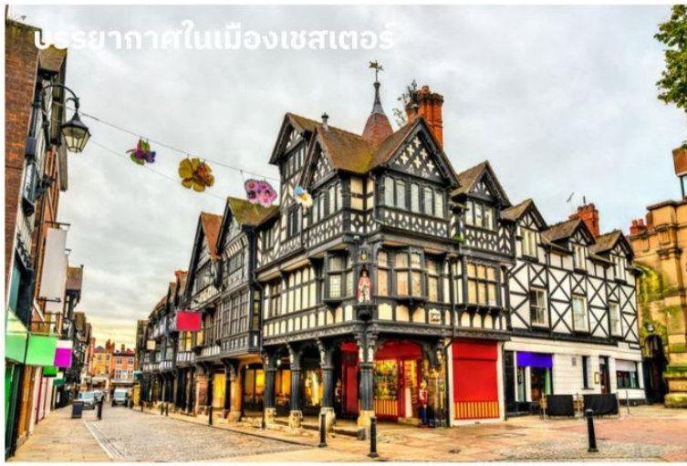
บรรยากาศในเมืองเชสเตอร์

จากนั้นนำท่านเดินทางสู่ เมืองเชสเตอร์ (Chester) ใช้เวลาเดินทางประมาณ 1 ชั่วโมง เชสเตอร์เมืองเก่าที่ค้นพบโดยชาวโรมันเมื่อประมาณ 2,000 ปีมาแล้ว นำท่านผ่านชมตัวเมืองอันสวยงามทางตอนเหนือของแคว้นเวลส์ ลักษณะของสถาปัตยกรรมของอาคารบ้านเรือนเป็นแบบทิวดอร์ อันเป็นเอกลักษณ์เฉพาะของที่นี่โครงสร้างตึกและบ้านเรือนที่จะทำจากไม้และทาสีขาวดำซึ่งจะเห็นได้ทั่วไปไปแทบจะทุกถนน ซึ่งเสริมให้บรรยากาศของเมืองนี้มีเสน่ห์ และแฝงความน่ารักเอาไว้ นอกจากนี้ตึกบางแห่งยังเป็นตึกเก่าแก่ตั้งแต่สมัยปี ค.ศ.1488 อีกด้วย