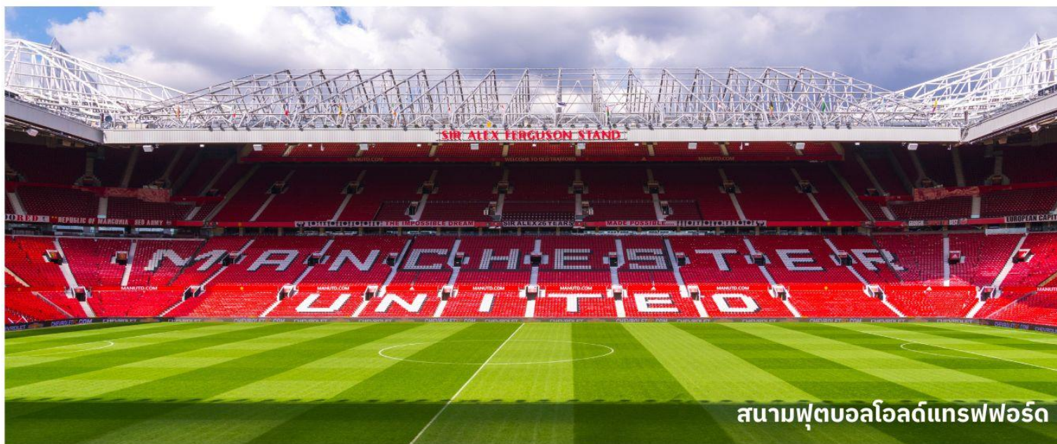
สนามฟุตบอลโอลด์แทรฟฟอร์ด

ให้ท่านได้เที่ยวชมส่วนต่างๆของสนามละประวัติความเป็นมาของสโมสรแห่งนี้ จากนั้นอิสระให้ท่านเลือกซื้อของที่ระลึกของทีมสโมสรแมนเชสเตอร์ยูไนเต็ด ในร้าน MEGA STORE ที่มากมายไปด้วยของที่ระลึกหลากหลายชนิดสำหรับแฟนบอล