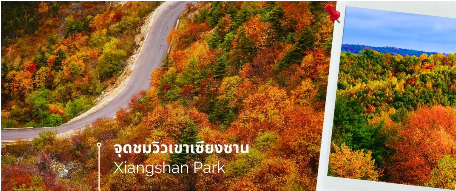
จุดชมวิวเขาเซียงซาน Xiangshan Park

เซียงซานมีชื่อเสียงทั้งในและต่างประเทศ ในปี 1986 ได้รับการจัดอันดับให้เป็นหนึ่งใน "จุดท่องเที่ยว 16 แห่งใหม่ของปักกิ่ง" เดิมรู้จักกันในชื่อสวน Jingyi หรือ "Jingyiyuan" ครอบคลุมพื้นที่ราว 1,175 ไร่ เซียงซานมีประวัติศาสตร์อันยาวนานกว่า 900 ปี ตั้งแต่สมัยราชวงศ์หยวน หมิง และชิง เคยเป็นที่พักผ่อนตากอากาศของ