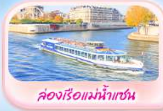
คลองเรือแม่น้ำแซน