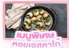
เมนูพิเศษ หอยออสคาโก้

เยอรมัน เนเธอร์แลนด์ เบลเยียม ฝรั่งเศส Keukenhof