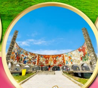
อนุสรณ์สถาน รัสเซีย-จอร์เจีย