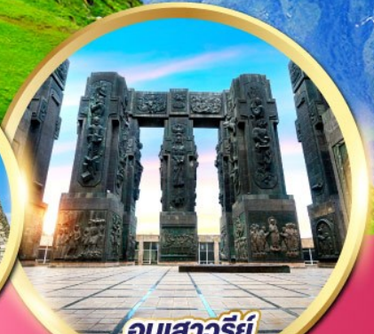
อนุสาวรีย์ ประวัติศาสตร์จอร์เจีย