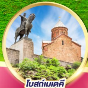
โบสถ์เมเตคี