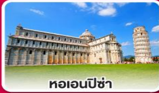
หอเอนปิซา