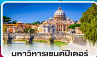
มหาวิหารเซนต์ปีเตอร์