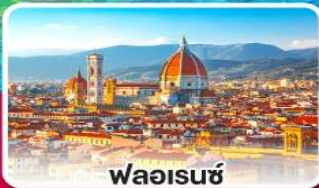
ฟลอเรนซ์