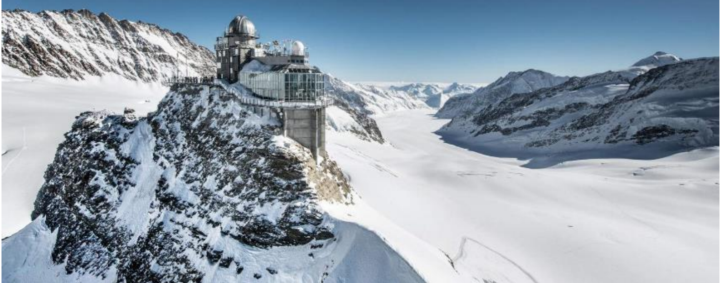
กลางวัน รับประทานอาหารกลางวัน ณ ภัตตาคารบนยอดเขา