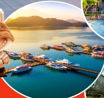
ทะเลสาบสุริยอันจินตรา