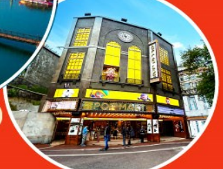
ร้าน POP MART ใหญ่ที่สุดในไต้หวัน