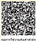
กฏการใช้งานสืบค้นภาพ

ผู้เกี่ยวข้อง : โรงแรมสำหรับนักท่องเที่ยว โรงแรม โฮมสเตย์ และที่พักอื่นๆ