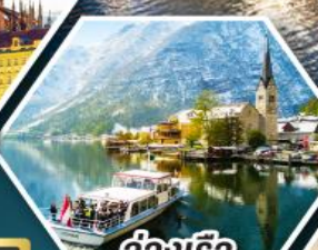
ล่องเรือ ทะเลสาบอัลสติก