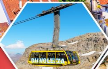
กระเช้าอิตาลี