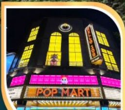
ร้านPOP MART ที่ใหญ่ที่สุดในไต้หวัน