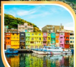
ท่าเรือเจิ้งปิ่น