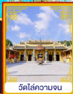
วัดไล่ความจน