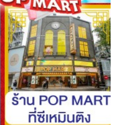
ร้าน POP MART ที่ซีเหมินติง