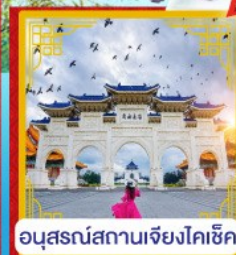
อนุสรณ์สถานเจียงโคซิก