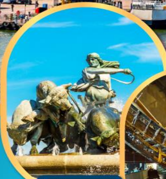
น้ำพุแห่งราชินีเกฟ็อน