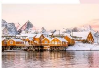
หมู่บ้าน Sakrisoy