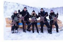
สนุกกับกิจกรรมจับปูยักษ์

00.00 น. ออกเดินทางสู่ เมืองคีร์กเคนส โดยสายการบิน...เที่ยวบินที่... 00.00 น. เดินทางถึงสนามบินเมืองคีร์กเคนส