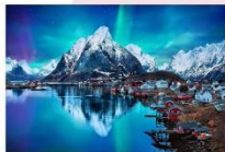
หมู่เกาะโลโฟเทน

00.00 น. ออกเดินทางสู่ เมืองเลกเนส โดยสายการบิน Scandinavian Airlines เที่ยวบินที่ SK 4106 แวะเปลี่ยนเครื่องที่เมือง Bodo เป็นสายการบิน Wide roe WF 810 00.00 น. เดินทางถึงสนามบินเมืองเลกเนส