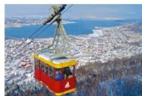
Tromso Cable Car

** ที่พัก CLARION HOTEL THE EDGE OR SIMILAR **