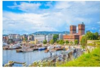
เมืองออสโล

06.10 น. เดินทางถึงนครอิสตันบูล ประเทศตุรกี (แวะเปลี่ยนเครื่อง) 09.00 น. ออกเดินทางสู่กรุงออสโล ประเทศนอร์เวย์ เที่ยวบินที่ TK 1751 11.00 น. เดินทางถึงสนามบินสนามบินเมืองออสโล