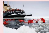
ล่องเรือตัดน้ำแข็ง Ice Breaker