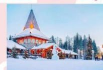
หมู่บ้านซานต้าครอส

15.25 น. ออกเดินทางสู่อิสตันบูล ประเทศตุรกี เที่ยวบินที่ TK 1750 21.10 น. เดินทางถึงสนามบินอิสตันบูล (แวะเปลี่ยนเครื่อง)