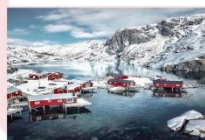
หมู่บ้าน Nusfjord

** พักที่ ELIASSEN RORBUER OR SIMILAR **