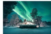
Glass Igloo Hotel

** พักที่ NORTHERN LIGHTS VILLAGE OR SIMILAR **