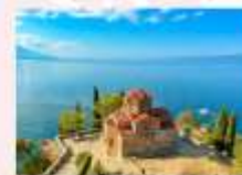
St. John at Kaneo Church

** พักที่ Hotel Holiday Inn 4* หรือเทียบเท่า **