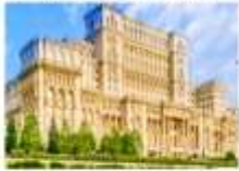
เมืองบูคาเรสต์