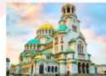
Alexander Nevsky Cathedral

15.45 น. ออกเดินทางสู่สนามบินอิสตันบูล เที่ยวบิน TK1032