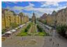
เมืองซีบีอู