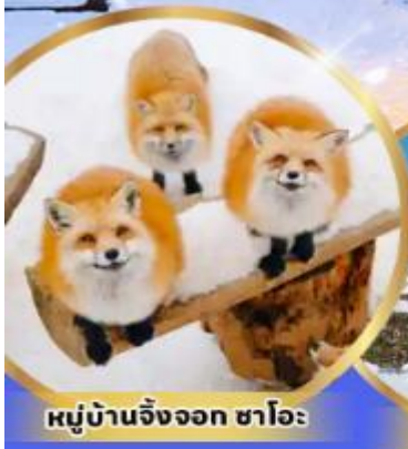
หมู่บ้านจิ้งจอก ซาโอะ