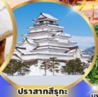
ปราสาทสิรุกะ