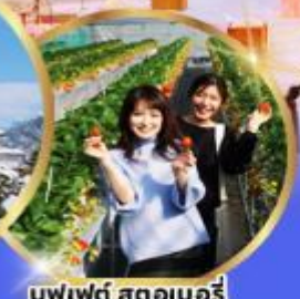
บุฟเฟต์ สดอเบอริ เท็มสาดจากต้น