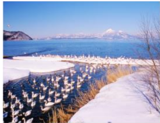
ทะเลสาบอินาวะชิโร Inawashiro-ko