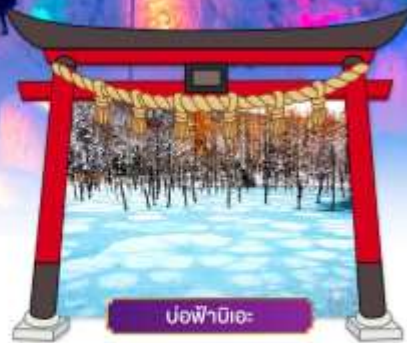
บ่อฟาร์มิเอะ