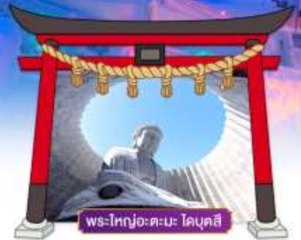
พระใหญ่อะตะมะ โดบุตสึ