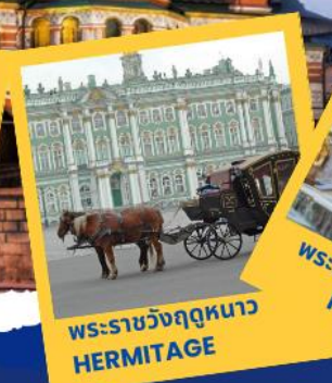
พระราชวังฤดูหนาว HERMITAGE