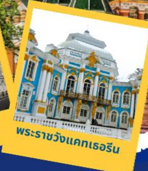
พระราชวังแคเธอรีน