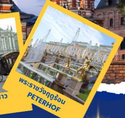
พระราชวังฤดูร้อน PETERHOF