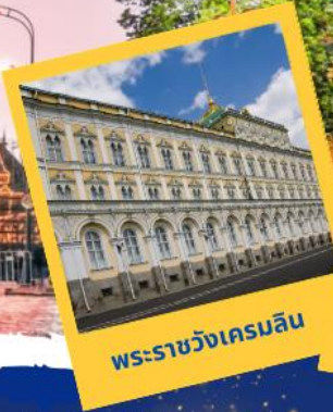
พระราชวังเครมลิน