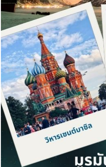
วิหารเซนต์บาซิล