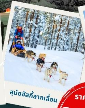
สุนัขฮัสกีลากเลื่อน