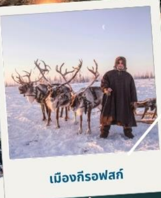
เมืองก็รอฟล์ค