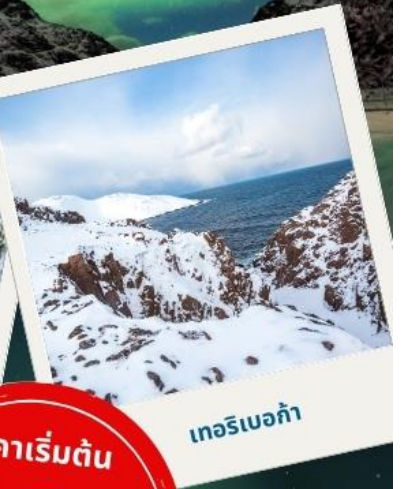
เทอริเบอก้า