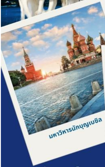
มหาวิหารนักบุญเบซิล