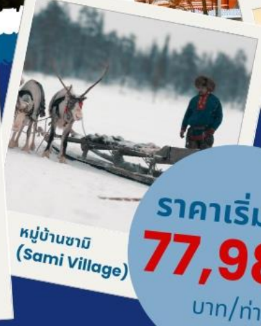
หมู่บ้านซามิ (Sami Village)