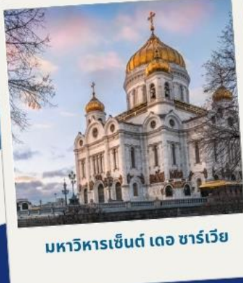
มหาวิหารเซนต์ เดอ ชาร์เวีย