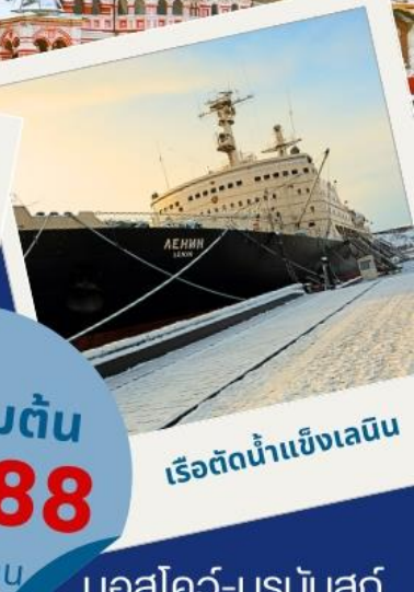
เรือตัดน้ำแข็งเลนิน