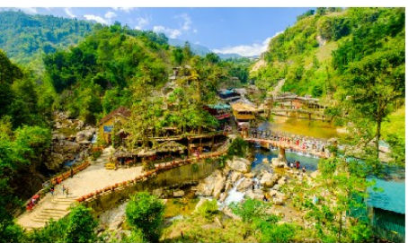
หมู่บ้านก๊ิต ก๊ิต