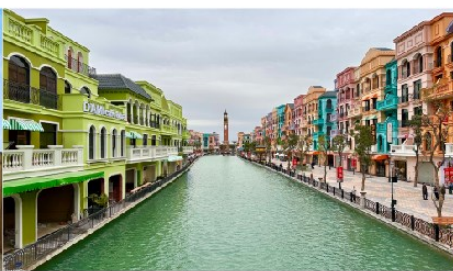
เมก้าแกรนด์เวิลด์ฮานอย