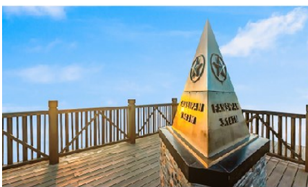
ยอดเขาฟานซิปัน