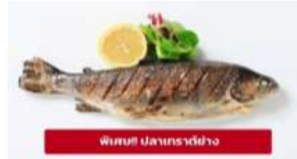
พิเศษ! ปลาเทราต์ย่าง

เที่ยง ๑๐ รับประทานอาหารเที่ยง (มื้อที่3) เมนูพิเศษ ปลาเทราต์ย่างท่านละ 1 ตัว นำท่านเดินทางสู่ เมืองอินส์บรุค (Innsbruck) (ระยะทาง 226 ก.ม. / 3.30 ชม.) ตั้งอยู่บนที่ราบลุ่มแม่น้ำอินน์ กลางหุบเขาของเทือกเขาแอลป์ ซึ่งสามารถ มองเห็นยอดเขาสูง