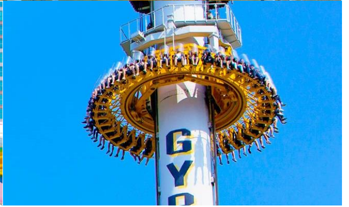
เที่ยง อีระอาหารกลางวัน ณ สวนสนุกล็อตเต้เวิลด์ (เพื่อให้ท่านได้สนุกอย่างเต็มที่)