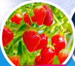
ไรสตอร์เบอร์รี่