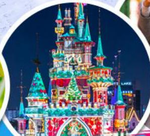
สวนสนุกกล็อดเต้