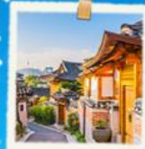
หมู่บ้านนูกซอน