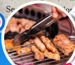
ดูอย่างเกาหลี