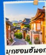
บุคซอนฮันอก