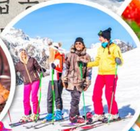
เล่นสกีจุใจ