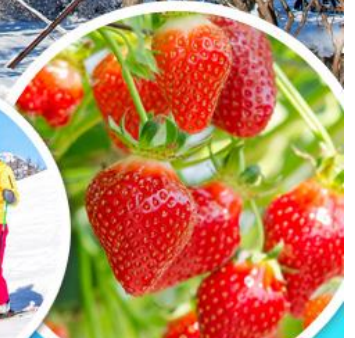
ไร่สตรอว์เบอร์รี่