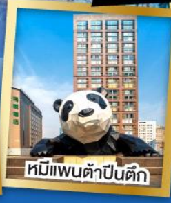
หมีแพนด้าปิ่นตึก