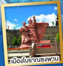
เมืองโบราณชงพาน