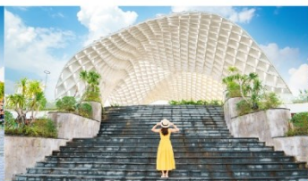
สวนเอเปค