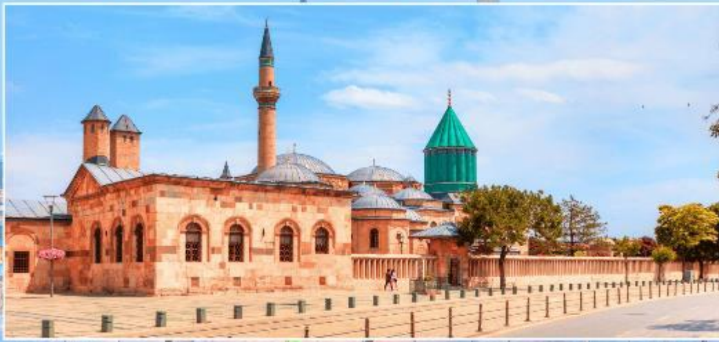
พิพิธภัณฑ์เมฟลานา

เย็น รับประทานอาหารเย็น ที่พัก ✈️ โรงแรมมาตรฐานตุรเคีย 4-5ดาว หรือเทียบเท่า