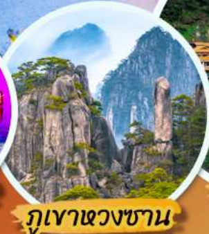
ภูเขาทองชัน