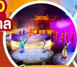
ชมโชว์อลังการ