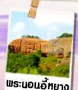
พระนอนอภัย