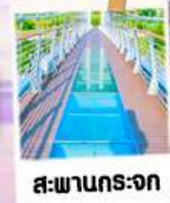
สะพานกระจก